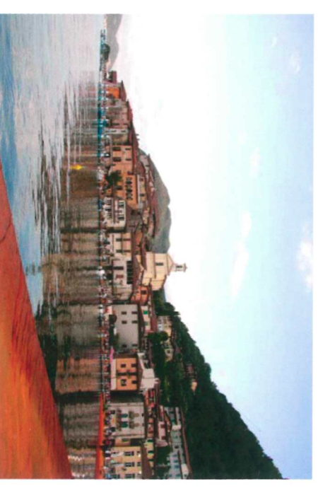
Monte Isola – The Floating Piers, 2016